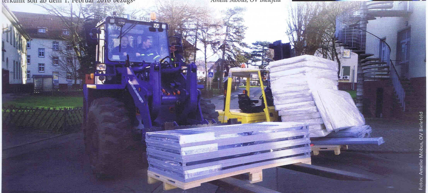
Das Bergungsräumgerät des OV Bünde und der Gabelstapler des OV Bielefeld